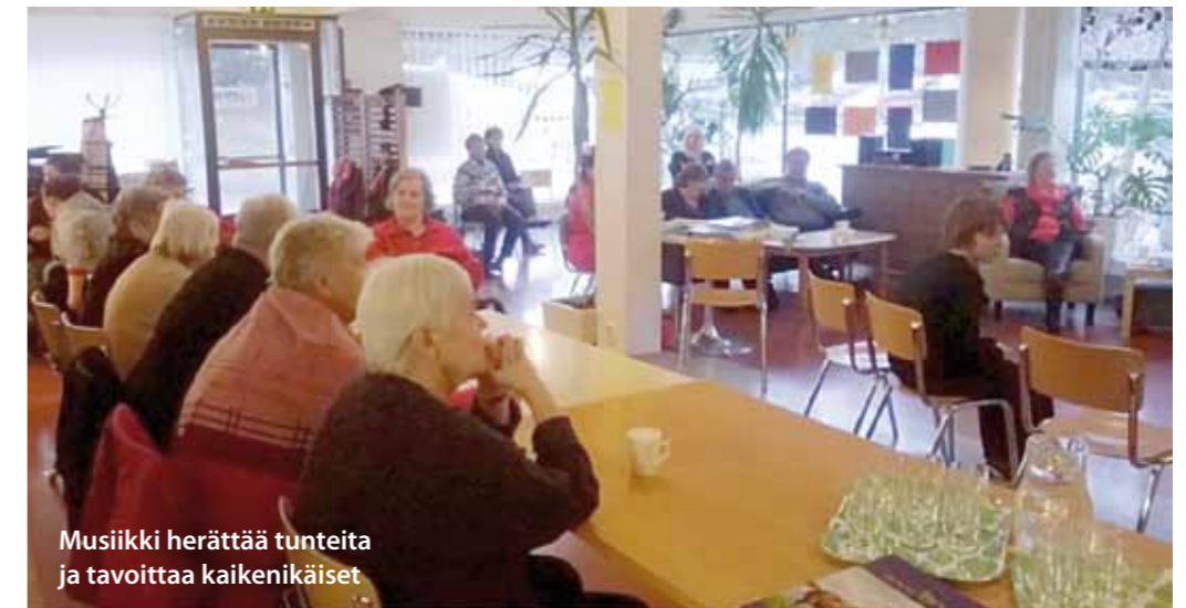
Musiikki herättää tunteita ja tavoittaa kaikenikäiset

Olkkarin seinän takana sijaitsee Tesoman Naapurin toimipiste, Kohtaamispaikka Wihreä Puu, jonka toimintaan kuuluu avoin perhetoiminta, kouluikäiset lapset ja nuoret sekä ikäihmisryhmät. Olkkarin ja Naapurin