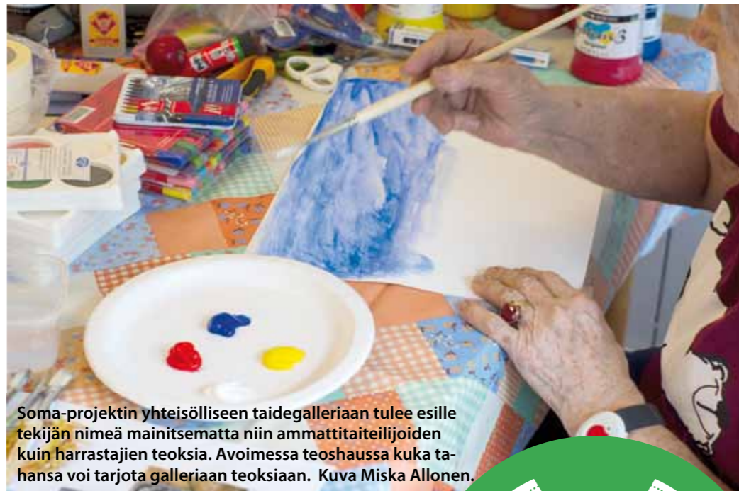
Soma-projektin yhteisölliseen taidegalleriaan tulee esille tekijän nimeä mainitsematta niin ammattitaiteilijoiden kuin harrastajien teoksia. Avoimessa teoshaussa kuka tahansa voi tarjota galleriaan teoksiaan.

ennaalin päätapahtuman aikaan syys-lokakuussa. Pikkuruiset kotimaalaukset yllättävät kaiteilta, betoniporsaista, seinistä, puista.