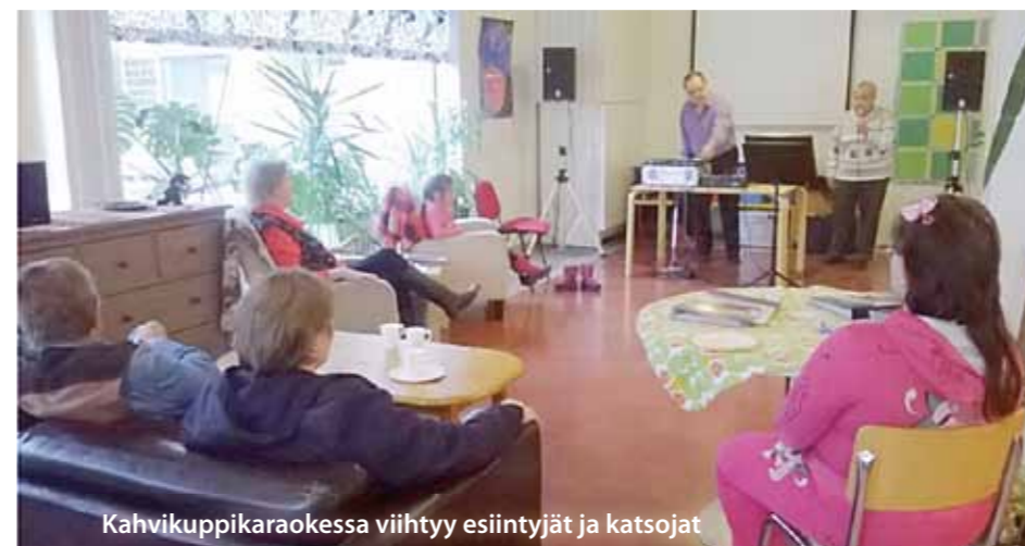
Kahvikuppikaraokessa viihtyy esiintyjät ja katsojat