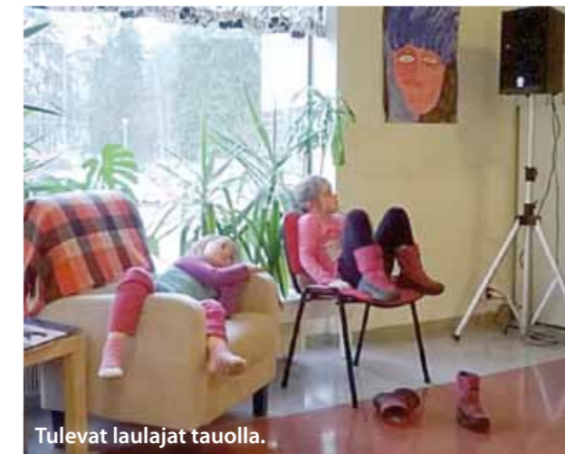
Tulevat laulajat tauolla.