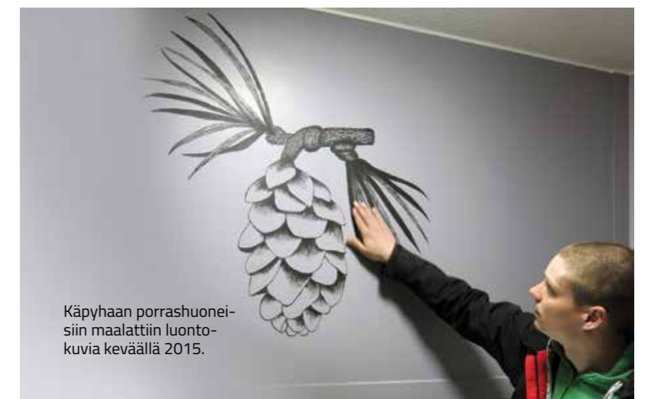
Käpyhaan porrashuoneisiin maalattiin luontokuvia keväällä 2015.